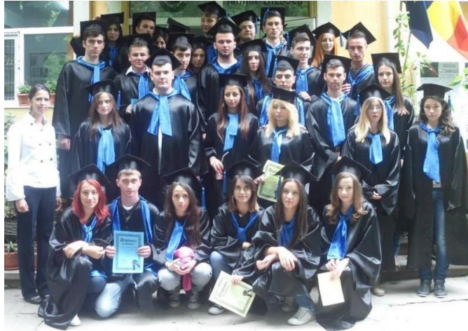
SERBAREA "ULTIMULUI CLOPOTEL" 2013